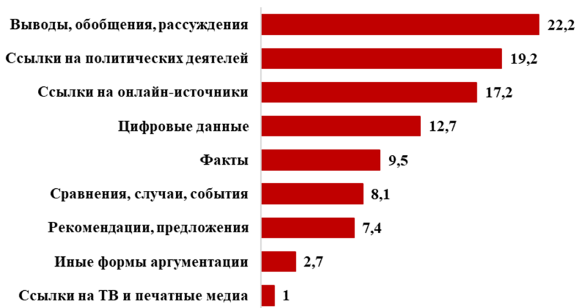
Рис. 1. Соотношение типов аргументации на основе анализа всех онлайн-дискуссий

Общий процент аргументации составил около 44,7% от всех постов, однако стоит упомянуть, что некоторые посты содержали несколько типов аргументации, некоторые содержали только один, в остальных аргументации не было. Больше всего использовались выводы, обобщения и рассуждения, связанные с повышением пенсионного возраста, последствиями реформы (см. рис. 1). Любопытно, что участники интернет-дискуссий часто ссылались на политических деятелей (к примеру, Путин, Медведев, Зюганов, Грудинин, Навальный, Матвиенко, Кудрин, Собчак, Брежнев, Ельцин, Горбачёв, Ленин), и различные информационные ресурсы (около 95% составили онлайн-источники, среди которых, социальные сети (преимущественно Facebook, Twitter, VKontakte и YouTube), онлайн-медиа (в основном статьи и высказывания политических деятелей), сайты политических партий (Единая Россия, КПРФ) и отдельных политиков (Навальный), статистические онлайн-ресурсы, нормативно-правовые документы; ТВ и печатные СМИ упоминались крайне редко).